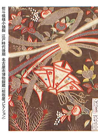
蟹模様の更紗 18・19世紀 名古屋博物館蔵(松坂屋レクシヨ)