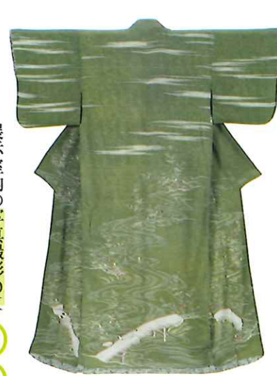
右上：魚模様の「チヤンイ文化」(紀元後1000年〜1400年頃) 左上：菊に八橋模様の小袖 江戸時代中期 左下：女郎花模様の小袖 江戸時代中期〜後期 いずれも名古屋博物館蔵(松坂屋レクシヨ)