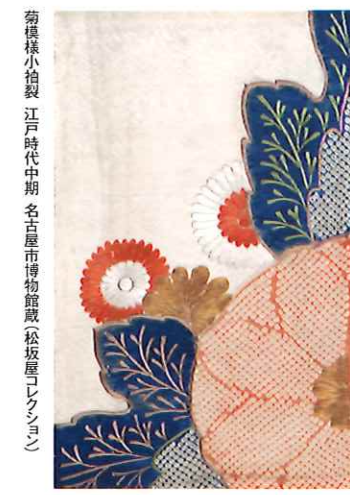
菊模様の小袖 江戸時代中期 名古屋博物館蔵(松坂屋レクシヨ)