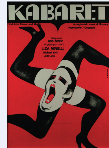
Poster Museum at Wilanów Dept. of The National Museum in Warsaw